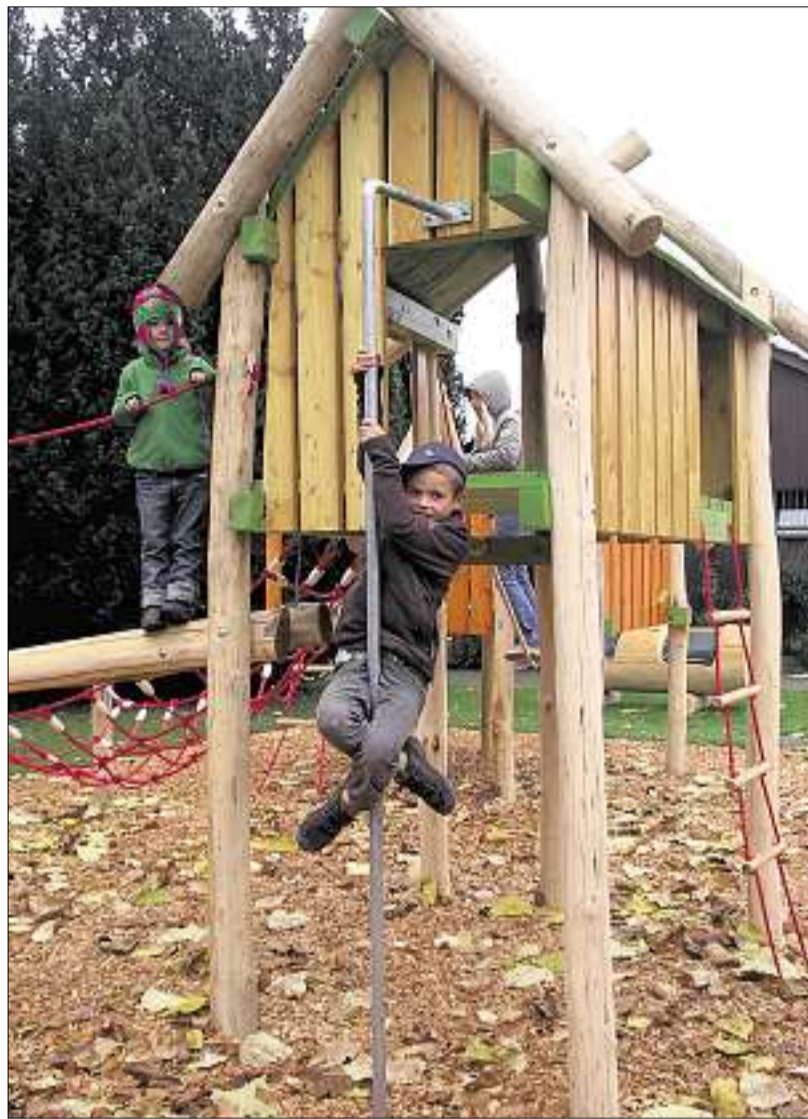
Die Kinder haben den neuen Spielplatz bereits in Beschlag genommen – und freuen sich daran.